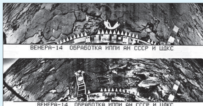
Панорамы поверхности Венеры, полученные аппаратом «Венера-14».

ют искусственные спутники Земли, говорит тот факт, что еще до запуска объекта «Д» начались подготовительные работы по лунной программе. Ниже приведем цитату из его доклада на заседании Президиума АН 14 сентября 1956 г.: