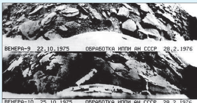
Панорамы поверхности Венеры, переданные на Землю аппаратами «Венера-9» и «Венера-10».