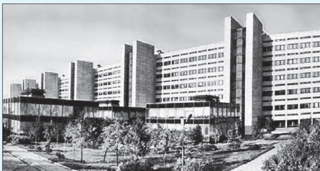
Здание Института космических исследований. Москва.

сконцентрировать усилия на нем. Такой ведущей темой стала Венера*.