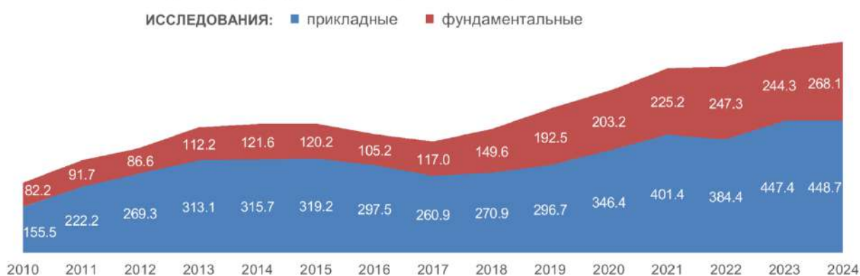
Рис. 3. Расходы на гражданскую науку из средств федерального бюджета по видам работ (млрд руб. в действующих ценах)