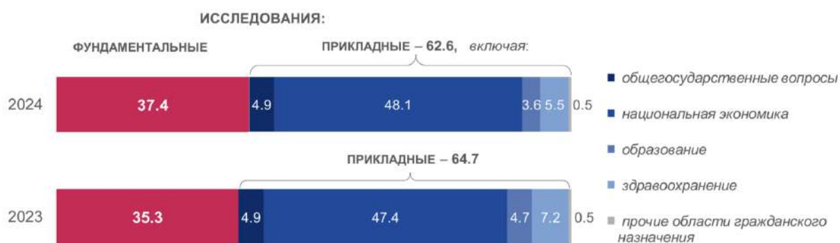
Рис. 4. Структура расходов на гражданскую науку из средств федерального бюджета по разделам и подразделам классификации расходов бюджетов (%)